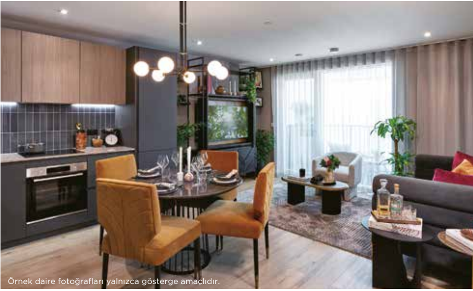
Örnek daire fotoğrafları yalnızca gösterge amaçlıdır.