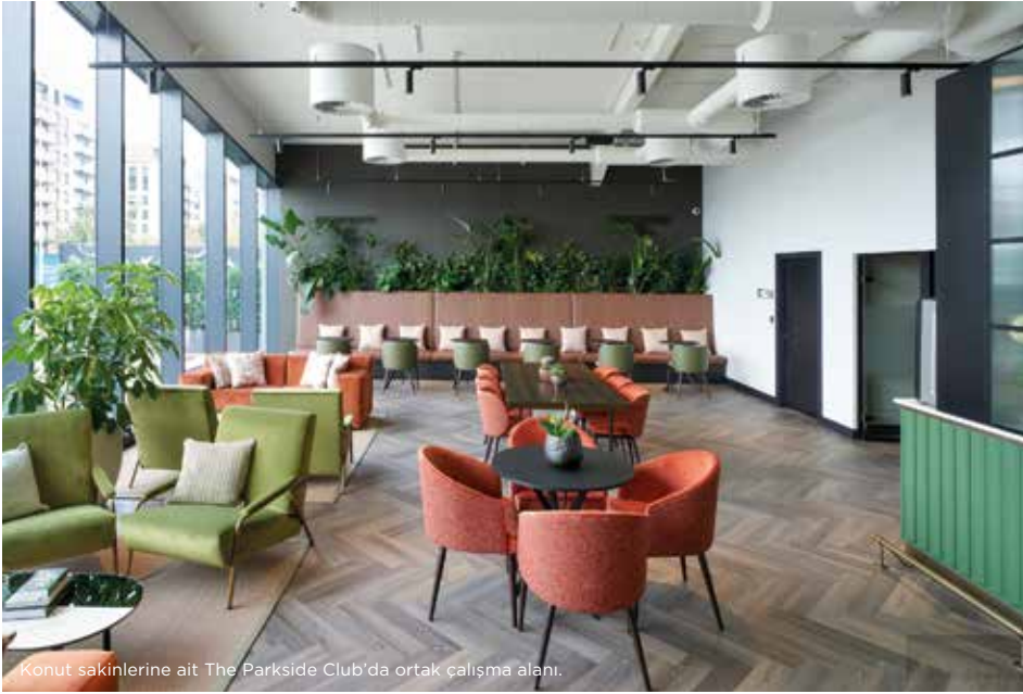
Konut sakinlerine ait The Parkside Club'da ortak çalışma alanı.